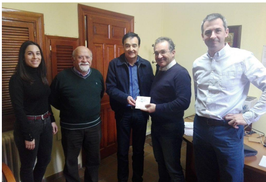
Fotos acto de entrega del estudio en febrero de 2018